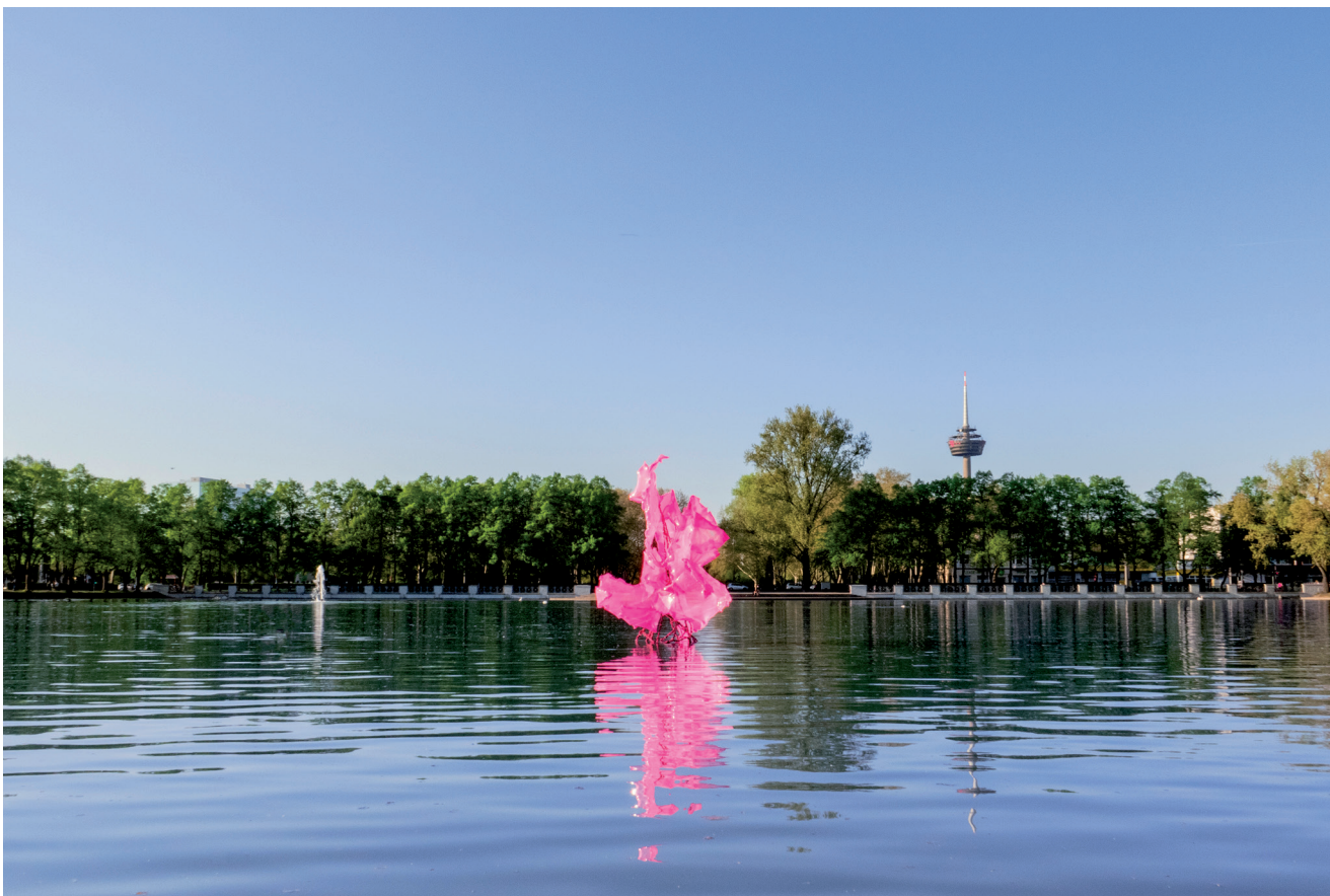
ALTEROCENTRIC EUDAIMONIA, 2019, Aachener Weiher, Köln / Cologne