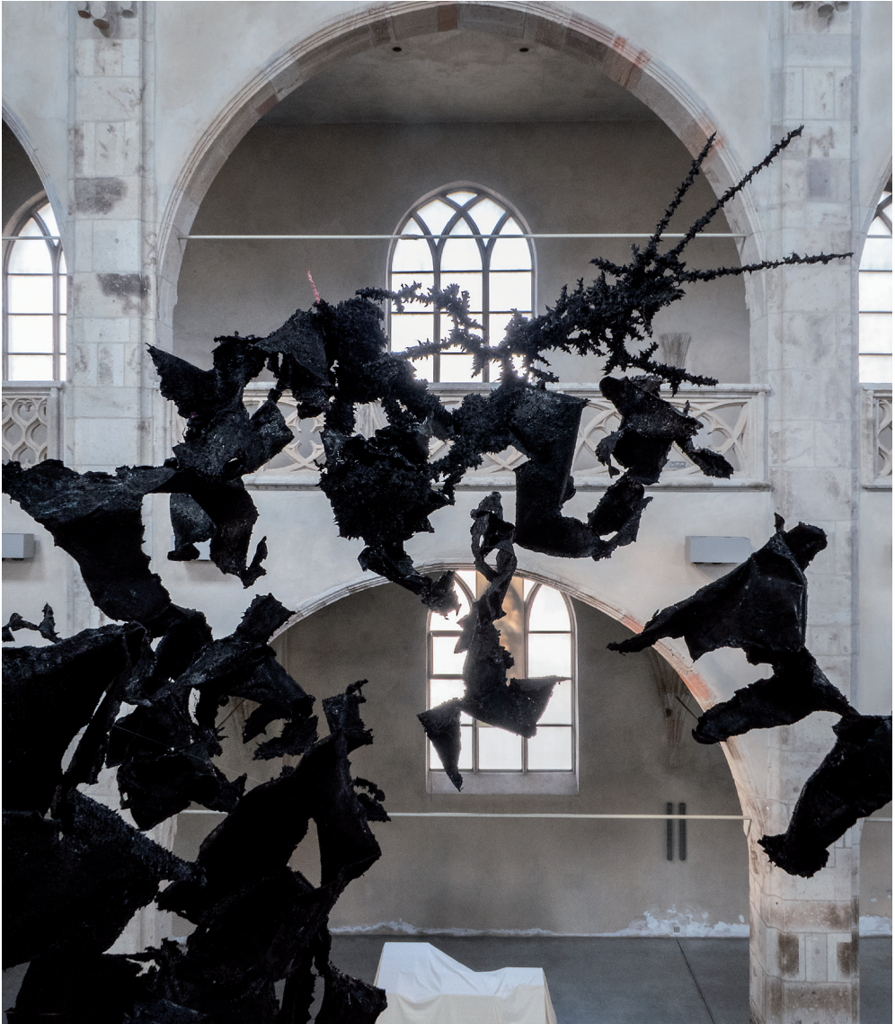
ALTEROCENTRIC EUDAIMONIA, 2019, Kunst-Station Sankt Peter Köln / Cologne, Fastenzeit / Lent